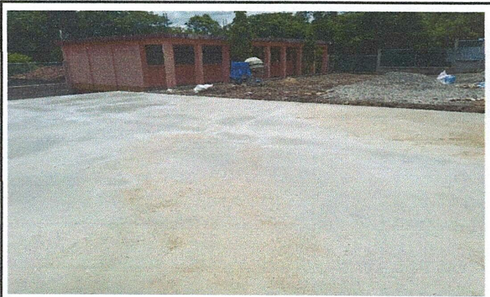
Foto 2: Vista general del patio lado norte del centro educativo donde se esta realizando el mejoramiento de losa de patio.