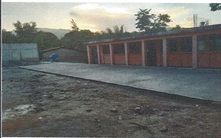
Foto 3: Vista general del patio lado sur del centro educativo donde se esta realizando el mejoramiento de losa de patio.