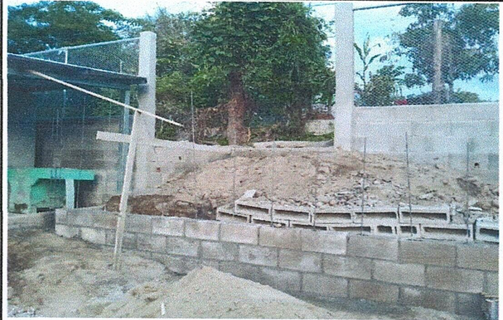
Foto 4: Vista general del lado este del centro educativo donde se instalará la puerta de metal.

Observación: Si es necesario se pueden agregar hojas adicionales y actualizar el número de hojas.