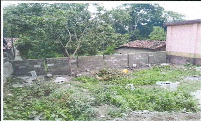
Foto 1: Vista general del centro educativo donde se esta realizando el mejoramiento de cerramiento perimetral.